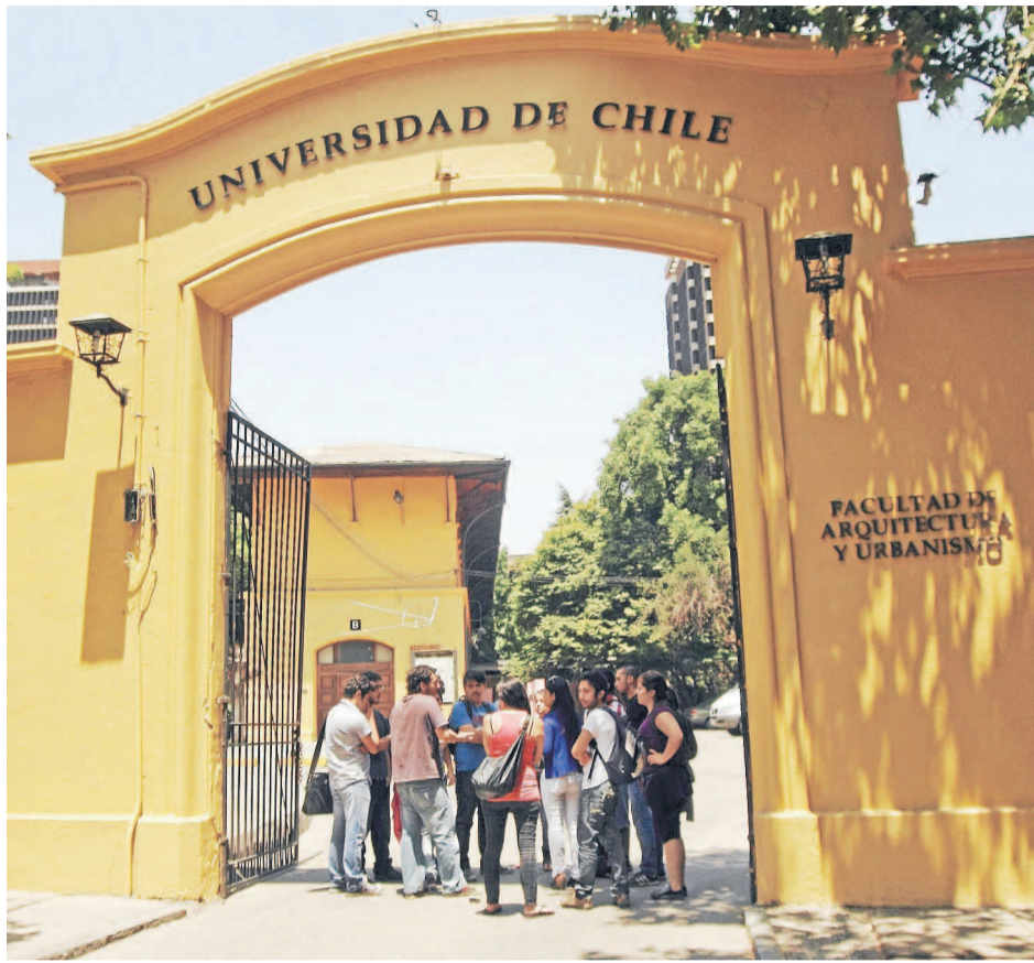
El evento se realizará en el campus Andrés Bello de la U. de Chile.