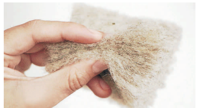
A diferencia de las comunes, ésta no es dañina para la salud.